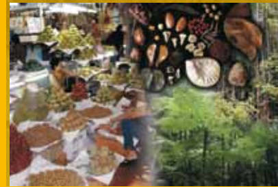
© Silva, mars 2010. Photos de une : B. Belem, E. Loffeier, C. Doumenge, R. Peltier, C. Fargeot.